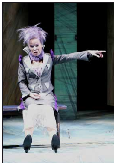
Die lustigen Weiber von Windsor - Frau Reich