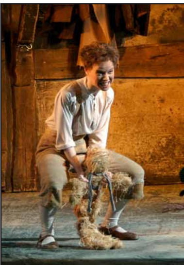
Hänsel und Gretel - Hänsel